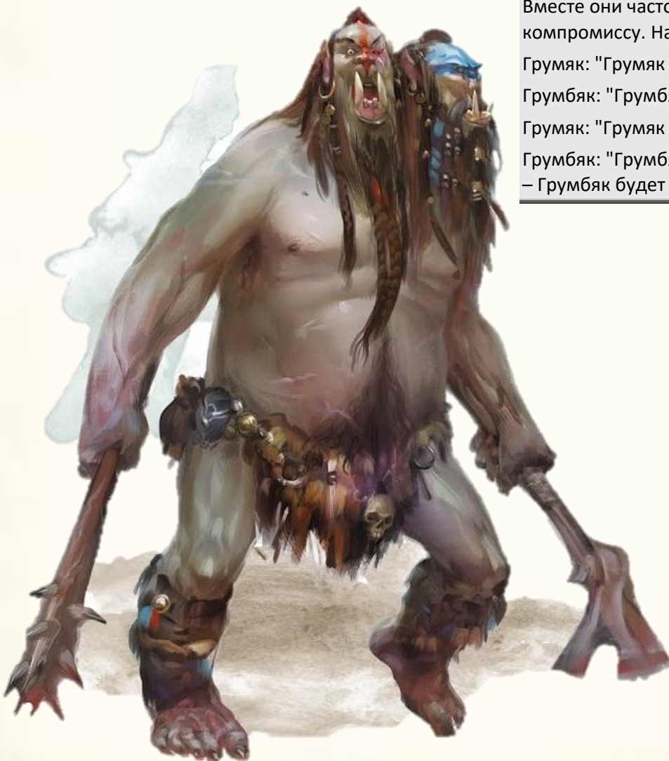
Эттин Грум-Грум . Картинка из открытых источников

Грумбьяк: "Грумбьяк согласен. Но если скажут глупость – Грумбьяк будет смеяться!"